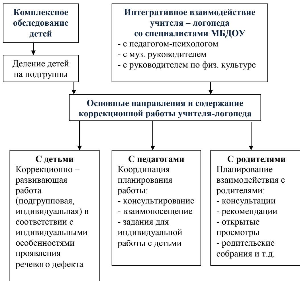
Схема коррекционно – образовательного процесса в МБДОУ № 47